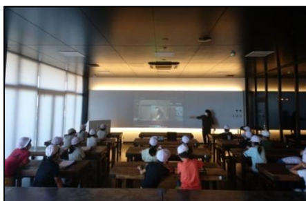
プロジェクターを使用し製造工程を説明