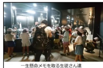
一生懸命メモを取る生徒さん達

現在、新型コロナウイルス感染拡大防止の為、本来予定していた修学旅行を実施することができず困っている学校が全国、そして新潟県内にも沢山あります。修学旅行は学校生活最大のイベント、中止になったらとても残念です。私たち SUWADA は小中学生 及び高校生の修学旅行や社会科見学を常に受け入れております。もちろん工場見学の際は感染予防対策を万全にして、手指消毒を実施。ソーシャルディスタンスを保ち、少人数にグループを分けてご見学頂きます。修学旅行が出来ないと諦めずに、こんな時だからこそ、