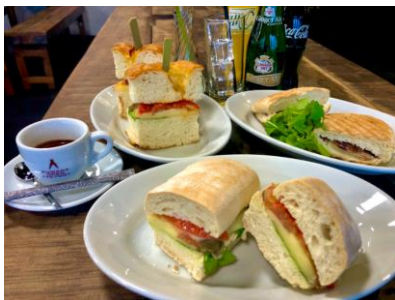
軽食には3種のサンドをご用意

社員食堂としてスタートした「SUWADA ショクドウ RESTAURANT CUIQUIRIT (クイキリ)」ですが、一般のお客様向けのランチ営業を始めて1ヶ月が経ちました。最近では、お客様のご注文が温かい飲み物に変わりはじめ、秋の深まりを感じます。工場見学だけでなく、ランチも楽しみにお越しになるお客様が増え、お食事時の笑顔やお帰りの際「美味しかった!」といただくお声かけに励まされております。笑顔あふれる食堂で、皆様のお越しをお待ちしております!