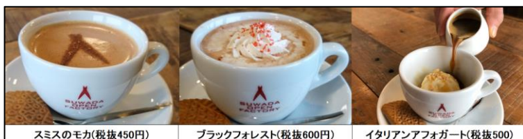
スミスのモカ(税抜450円)