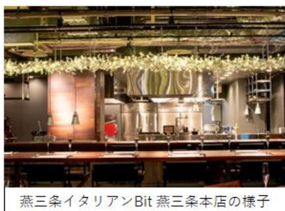
燕三条イタリアンBit 燕三条本店の様子

2021年7月21日に新規オープンする燕三条イタリアンBit 常盤橋店様の店内に再利用アート「SWD ART LAB」シャンデリアが飾られます！