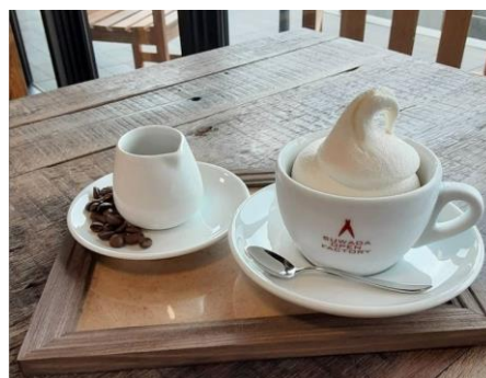
大人気の SUWA SUWA ソフト アフォガート仕立て