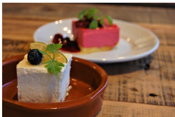
ライムのレアチーズケーキ（手前）フランボワーズムースのケーキ（奥） 厨房で手作りした味が自慢の自家製デザートです！

店内はクリスマスツリーやリースで華やかなクリスマス仕様となっています！是非、ご家族、恋人、ご友人とお越しください！