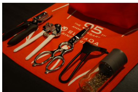
燕三条のキッチンツールが詰まっています！

毎年即日完売の SUWADA 福袋が 2022 年も登場します！ 今年は燕三条産のキッチングッズを集めた特別な福袋もご用意しました。 「つめ切りはもう持っているよ」という方にもおすすめです！