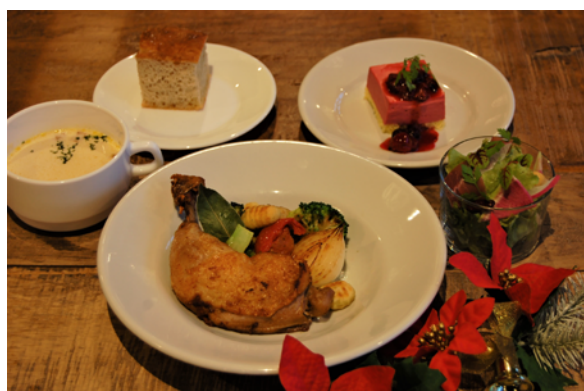
骨付きローストチキンは見た目も華やか。 生ハム入りのスペシャルサラダもついてきますよ～！