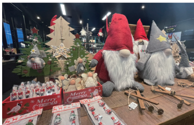
クリスマスのデコレーションが楽しくなるかわいい飾りが大集合！