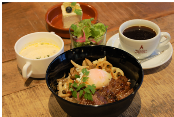
あのステーキ丼が、これからはいつでも食べられます。 温玉入りでとても贅沢ですね！写真はデザートセット。

また、新メニューといたしましてアフタヌーンティーセットの準備を進めています。発売開始をお楽しみに！