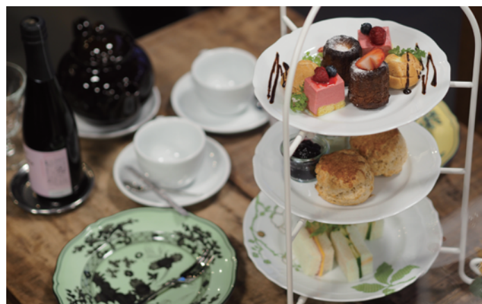
アフタヌーンティーセット1人分1,500円（税別）写真は2人分です。

1人分1,500円（税別）でFORTNUM & MASONの紅茶をポットサービスでお出ししており、ミニサンドイッチ、スコーン、カヌレと、日替わりのデザートと一緒に楽しめます！（写真は2人分です） 皆様のお越しをお待ちしております！