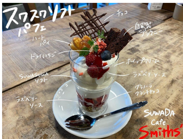
2月限定商品のスワスワソフトパフェはこのボリュームで550円（税抜） 飲み物とセットで750円（税抜）とお得です！

SUWADA Cafe Smiths' では、2月限定の新メニュー「スワスワソフトパフェ」を販売中です！