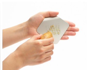
irogami piece of grater 1,600 円（税別）

一枚の紙をめくったような形をしているおろし金。燕市のツボエさんが開発した、10 通りのカラーパリエーションが目にも楽しいキッチンツールです。