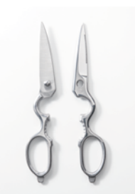
SUWADA キッチンシザース クラシック 6,500 円（税別）

機能的かつ無駄を排したオーソドックスな形のハサミは、まさにクラシックの名前にふさわしい一品です。