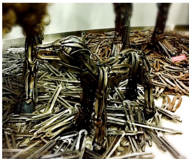
排材でつくられた羊。旧約聖書では、羊は人間の罪を身代わりとして負う象徴として描かれた。隣には小さな子羊も。