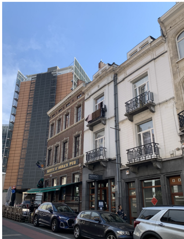
白いビルの右側1Fが新オフィス。なんと2軒隣はアイリッシュパブ。 左奥に見えるのがEU本部ビル「ベルレモン」。