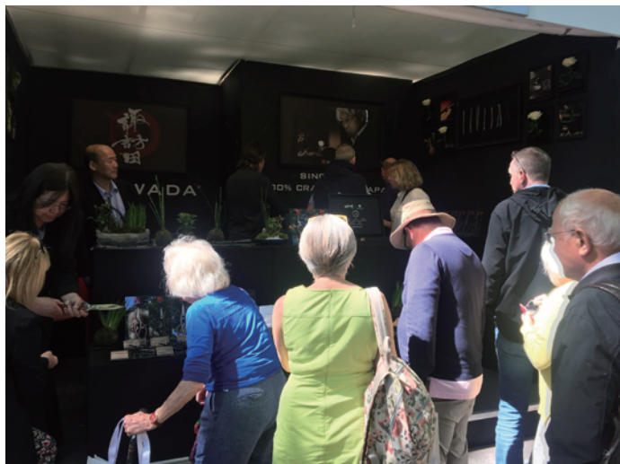
連日にぎわうSUWADAブースの様子（RHS CFS 2019）

今年もロンドン市民のみならず世界中の園芸愛好家があつまる歴史あるショウで、私たちの文化を発信してきます！