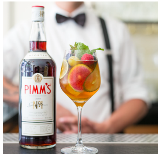
キュウリの青々とした香りがさわやかなピムスカクテル