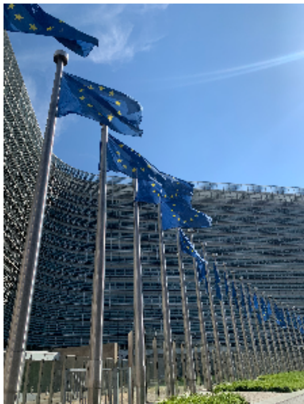
EU本部「ベルレモン」 事務総局など欧州委員会のおもな部局のほか、欧州委員会委員長と26人の欧州委員の事務所が入居している。

2022年1月31日、SUWADA EU支店をベルギー・ブリュッセルに設立しました！