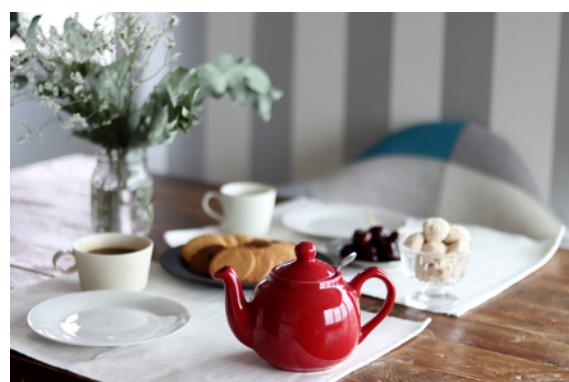
ティーポット 2CUP サイズ 4,620円(税込)

SUWADA Cafe では連日多くのお客様がアフタヌーンティーを楽しんでいらっしゃいます。