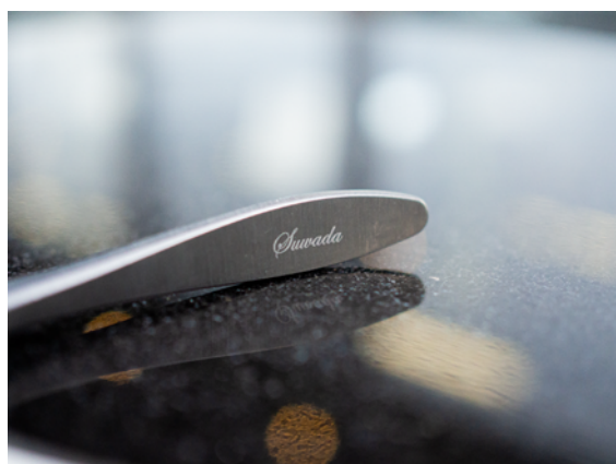
お名前はもちろん、イニシャルや日付などの刻印も人気です！

3月は卒業シーズンですね。そして4月は新たな始まりの季節。門出を迎える方に、一生モノのつめ切りを贈られる方が増えています。