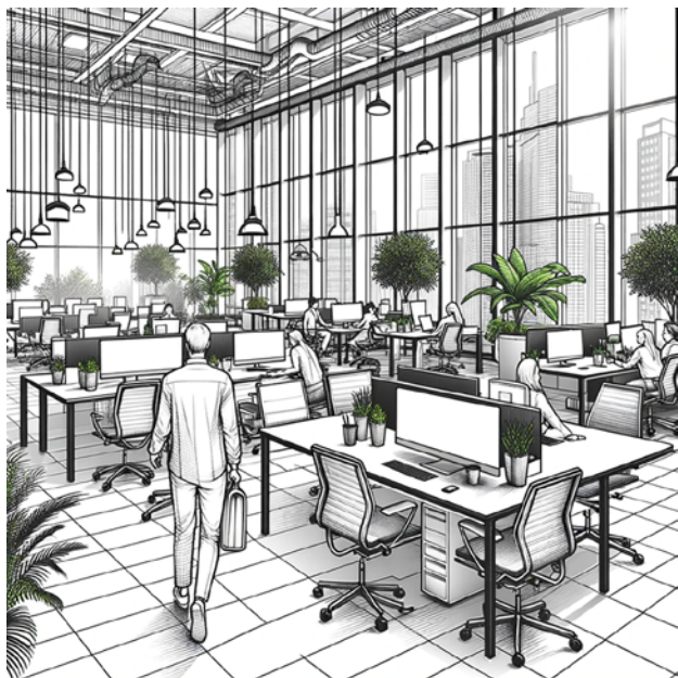
↑のイラストは、AIによる画像生成機能で作成。

2011年のオープンファクトリー化、2020年の社員食堂オープンなど製造業として先進的な取り組みや、働く環境の向上を続けてきた我々は、2024年にあらたなチャレンジを行います！