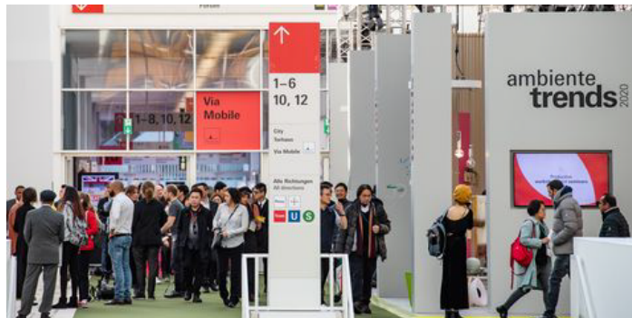
会期中には世界中のバイヤーが訪れる。