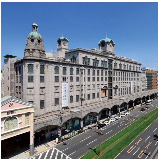
地域密着で圧倒的な支持を誇る山形屋

1751 年に創業し、九州に計 5 店舗を展開する山形屋グループ。1 月 17 日から 23 日までの 7 日間、本店の鹿児島山形屋様にて「第 18 回 大新潟展」が開催されます！