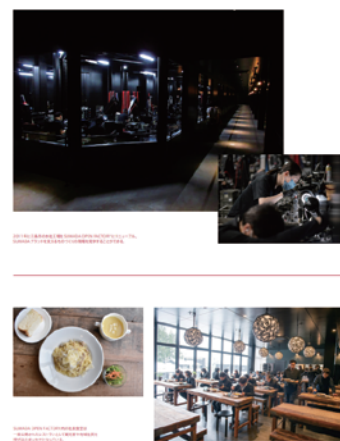
デザイン白書 企業×デザイン 176ページ

日本の各地や企業、行政のデザインの今を伝える「デザイン白書」が、GOOD DESIGN AWARD など主催する日本デザイン振興会よりリリースされました。企業 × デザインのコーナーで、SUWADA のオープンファクトリーや働く環境づくりの取り組みについて見開き 2 ページにわたりご紹介いただいています。同じく燕三条エリアで調理器具を製造販売している Conte さん、SUWADA のショップでも取り扱いのある高岡の能作さんも紹介されていますよ！このほかにも、行政とデザインの関係、地域とデザインの関係、デザインに関する統計資料など、充実した内容です。全て無料でご覧いただけますので、是非 QR コードからチェックしてみてください！