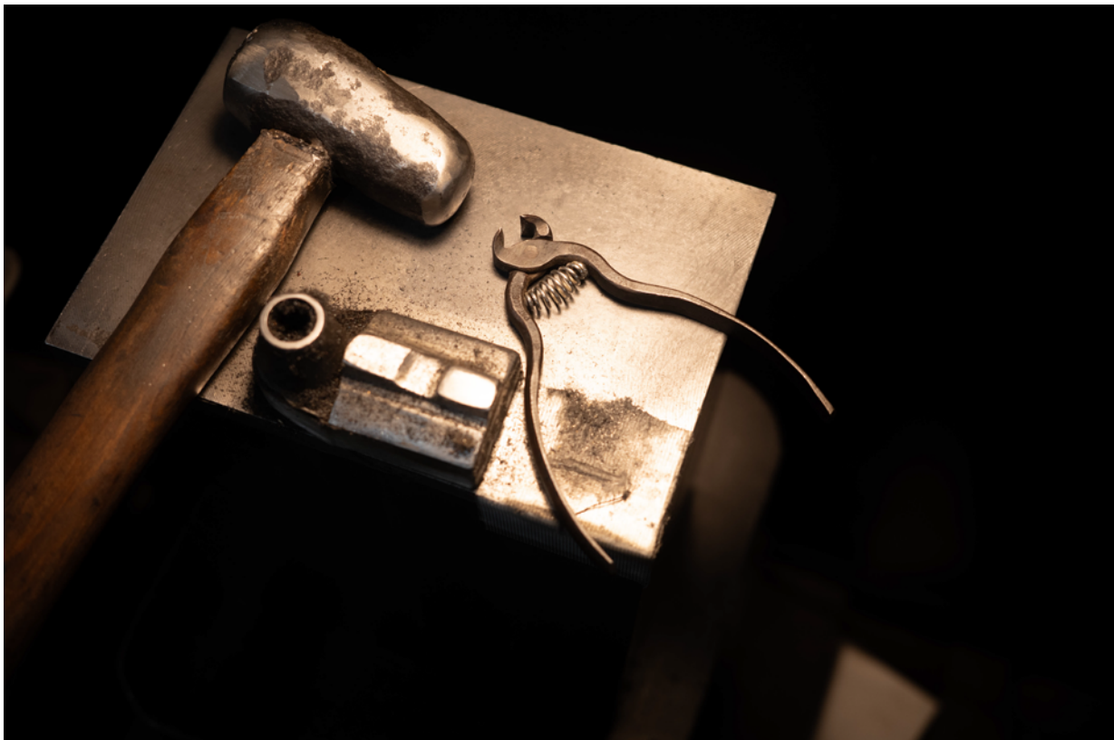
お客様からのメンテナンス依頼で里帰り中のつめ切り。約70年前にSUWADAで作られたもの。

永く使っていたんだ品物も、丁寧にメンテナンスをしてお返し致します。遠慮なくご連絡ください。