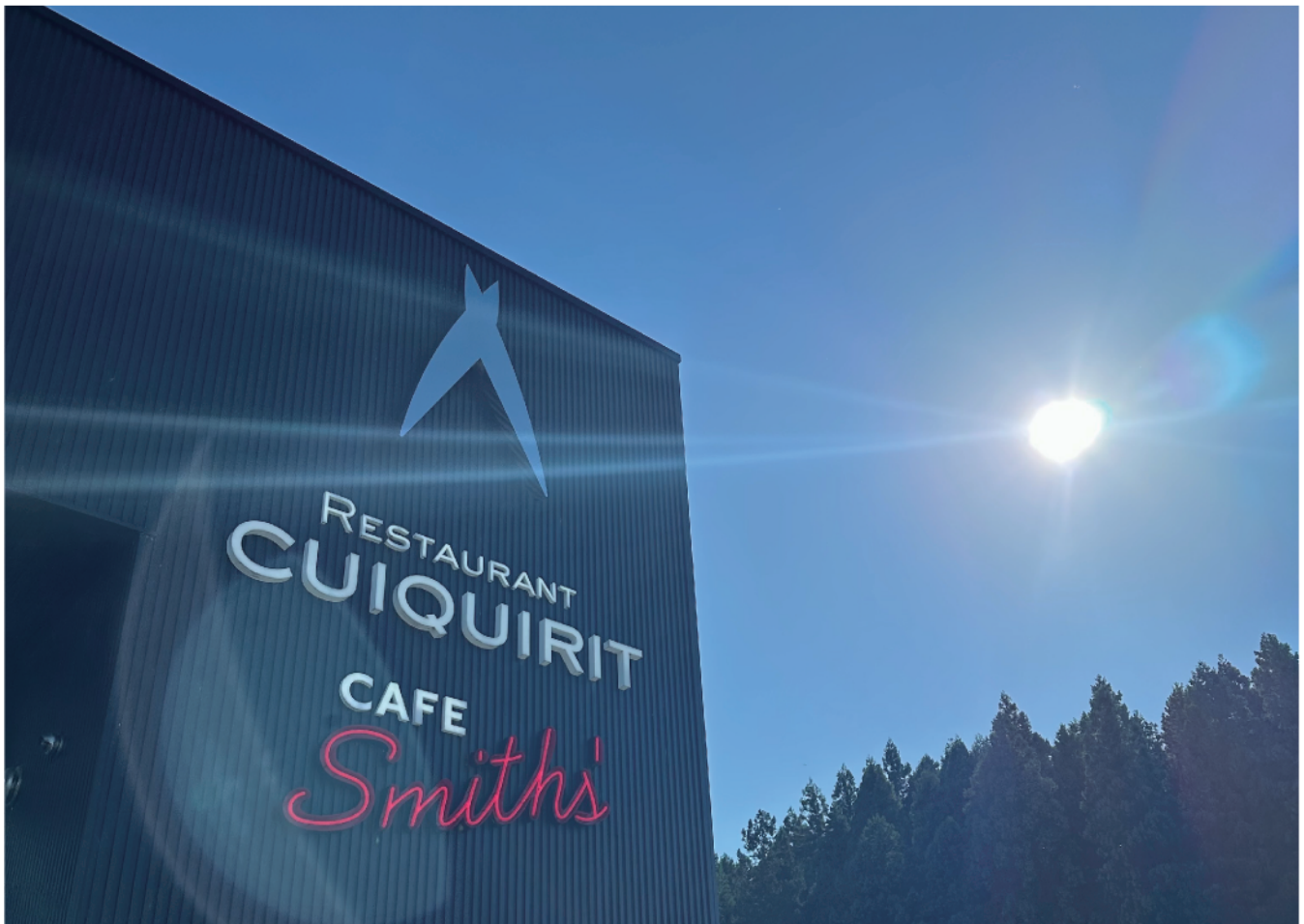
SUWADA OPEN FACTORYにて撮影

2024年も残すところあと2カ月を切りました。迫る冬と2025年へ向けて準備していきたいものです。