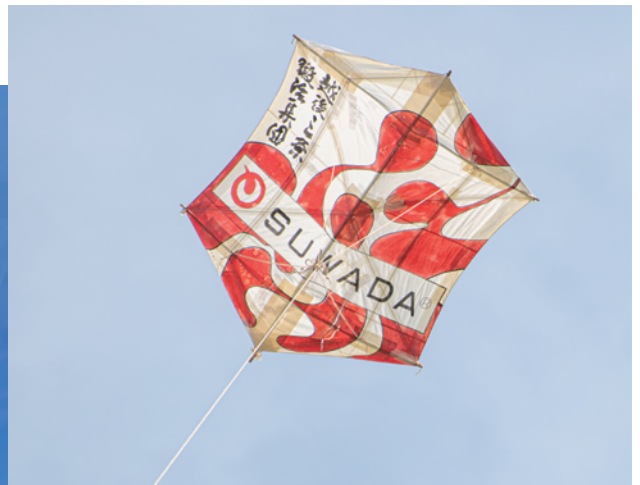
満点の青空に高々と揚がる凧（いか）たち。