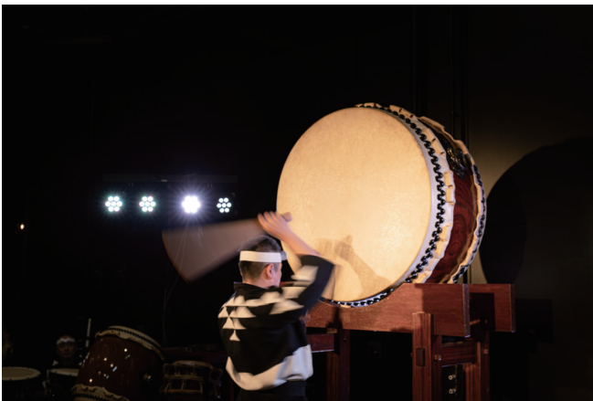
庄巻の鼓童パフォーマンス