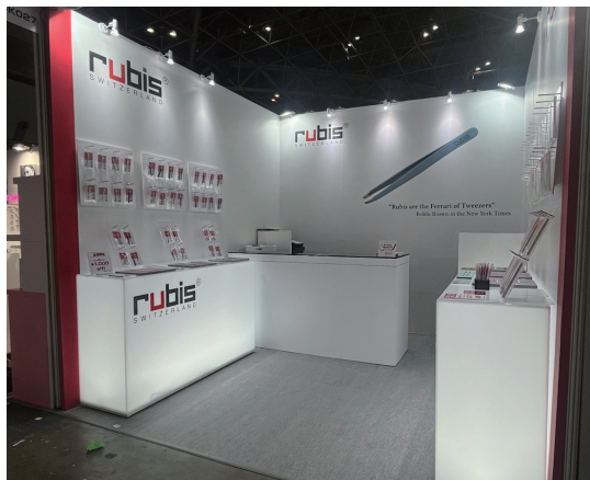
2025 年出展の様子 今年はつめ切りも販売します！

5月18日から5月20日まで、東京国際展示場にて開催される Beauty World Japan 2026（ビューティーワールドジャパン）に出展いたします！