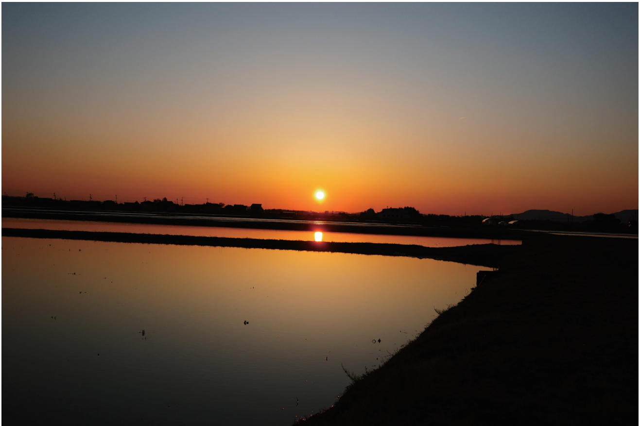
工場近くから見える夕やけ