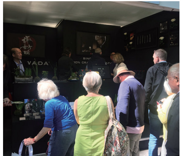
連日にぎわう SUWADA ブースの様子

イギリス王立園芸協会（RHS）が主催し世界最高のガーデン・ショーと名高い「チェルシーフラワーショー」に今年も SUWADA が出展いたします！