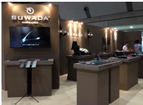
インテリアライフスタイル 2015 セレクトショップをイメージしたブース

今回はセレクトショップを意識したブースデザインで、お店での販売シーンを再現いたしました。さすがに国内で最も感度の高い展示会だけあり大好評。今年も多くのお客様とお会いすることができました。