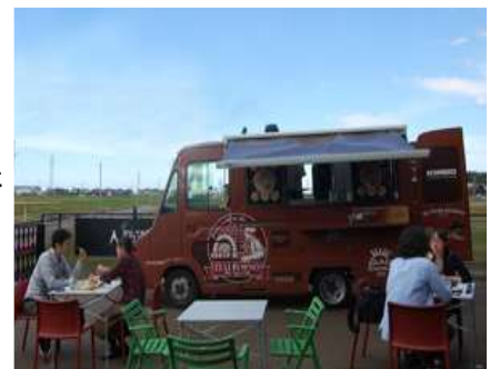
焼き立てピザはあっという間に売り切れ

また薪釜で焼き上げる本格ナポリピザのキッチンカーが登場！ MARUNAO と SUWADA の間を会期中往復してもらえました。熱々のピザをその場で焼き上げるのは上越市の名店ラ・ペントラッチャ様。用意した材料も早々に売り切れてしまい、すごい人気でした！