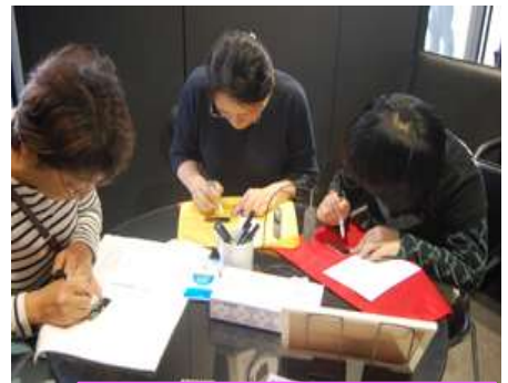
思い思いのデザインでプレート作り

2日間で約5名ずつ20組、計100名超のお客様をご案内しました。「オリジナルネームプレート制作」は、小さなお子様も体験できるので、お父さんお母さんと一緒にやっている方も多く、思い思いのデザインで制作を楽しんでいました。可愛いステンレスのプレート作りは、きっと楽しい思い出になったことでしょう。