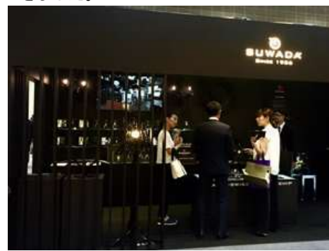
展示ブースの様子 メゾンオブジェ(左)とギフトショー(上)

一方日本では、9/7～9 の 3 日間、東京ビッグサイトにおいて「ギフトショー 2016 秋」が開催されました。今回は日本をテーマにした展示ゾーンの入入口という目立つ場所にブースを構え、定番のつめ切りだけでなくこの秋発売の新商品、また国内総代理店を務めるスイス rubis 社製