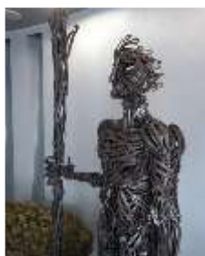
錆が出てきて経年変化が見られます