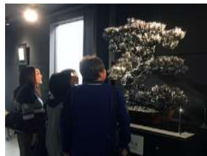
玄松に見入るお客様 「廃材とは思えない!!」

期間中 SUWADA では、ブランキングアート展を開催。つめ切りの精霊は もちろん、等身大のひつじの母子、獅子、そして、前述の玄松などがギャラリーに 展示されると、「専門のアーティストがいるんですか?」「廃材でできているとは思 えない!」と、皆様おどろいて写真に収めてくださいました。