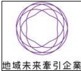
地域未来牽引企業

SUWADA は、12/22、「地域の特性を生かして高い付加価値を創出し、地域の経済成長を力強く牽引する事業を今後取り組むことが期待される」として、経済産業省より「地域未来牽引企業」に認定されました。