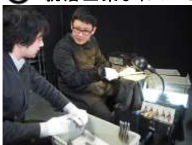
前回のインターンシップの様子

SUWADA は 1/25(金)、2/22(金)に 1 日インターンシップを実施します。工場見学、先輩社員とのランチ交流会、製造現場の作業体験などを通して入社してからの働き方やものづくりの楽しさを体感していただける楽しい一日となります。また、ワークショップで人気のメタルミニ盆栽作りも体験でき、作品はお土産としてお持ち帰りできます。両日とも定員 5 名ですので、どうぞお早目にお申込みください。